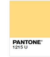
Rejected (Too Light)