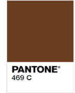
Rejected (Too Dark)