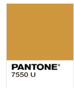
Rejected (Too Dark)