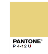
Rejected (Too Light)