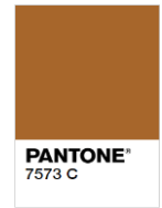
Rejected (Too Dark)