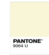
Rejected (Too Light)