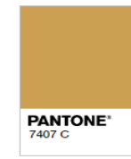
Rejected (Too Dark)