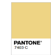
Rejected (Too Light)